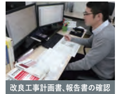
改良工事計画書、報告書の確認