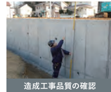
造成工事品質の確認