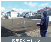
現場ロケーション