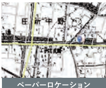
ペーパーロケーション

自信を持ってご提供できる地盤かどうか、土地の仕入れ前から対象となる土地全体の地盤を入念に調査しています。